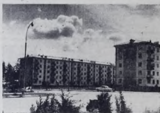
В нашем городе.

28 АВГУСТА. СКА Хабаровск — «Темп» Барнаул. «Амур» Благовещенск — «Локомотив» Красноярск. «Забайкалец» Чита — «Старт» Ангарск. «Армеец» Улан-Удэ — «Торпедо» Томск. «Ангара» Иркутск — «Металлург» Новокузнецк. «Торпедо» Рубцовск — «Луч» Владивосток. «Цементник» Семипалатинск — «Химик» Кемерово. «Машиностроитель» Павлодар — «Восток» Усть-Каменогорск.