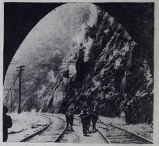
Байкал. Туристская тропа.