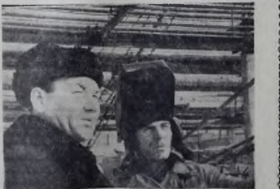
Подавено от каталитического платформина (НПЗ) воздвигается установка гидроочистки дизельного топлива.