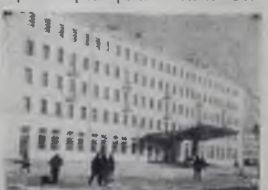
Редактор В. И. ПАНФИЛОВ

покинуть номера «люкс». Работники гостиницы приложили немало сил, чтобы создать в комнатах чудесный интерьер. «Люкс» располагает спальней, гостиной, кабинетом, ванной. В каждом номере изысканная мебель высокого качества. В гостинице установлен первый в городе пассажирский лифт, работает парикмахерская, подготавливается к открытию ресторан. А. КРИВОЙ.