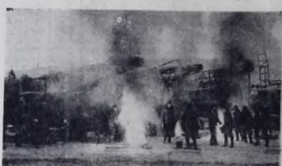
МАРКОВО. Мороз 40 градусов. Но это — не помеха. Сейчас отогреются у костра сейсморазведчики и уйдут по новой трассе на поиски кембрийской нефти.

Кроме Коли, в семье Константиновых четыре девочки, они развиваются нормально. Учится Коля не хуже своих сестер. Виталий КОМИН.