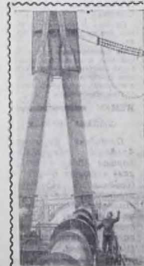
Снимок сделан в момент, когда заканчивался монтаж проводов высоковольтной линии электропередачи Запорожье—Николаев на напряжении 330 киловольт. Скоро по этим проводам, переброшенным через Днепр с помощью высоковольтных мачт, пойдет электрический ток.

Я. КАРПЕЛЬ, депутат городского Совета, председатель коммунальной комиссии.