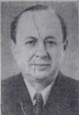
Известный советский драматург Владимир Наумович

Билль - Белоцерковский родился в простой рабочей семье. Рано начал он трудовую жизнь. Уже с 16 лет плавал матросом. Несколько лет работал в Америке кочегаром в земледелии. В бурный 1917 год Билль Белоцерковский вернулся на родину, принимал активное участие в октябрьских боях в Москве. В годы революции он взялся за перо. Читатель знает его как одного из лучших советских драматургов. В пьесе «Шторм» В. Н. Билль Белоцерковский один из первых в советской драматургии создал героические образы революционных моряков. Перу драматурга принадлежат также пьесы «Левое руля», «Штиль», «Голос недр» и другие. Сегодня В. Н. Билль Белоцерковскому исполняется 80 лет со дня рождения.