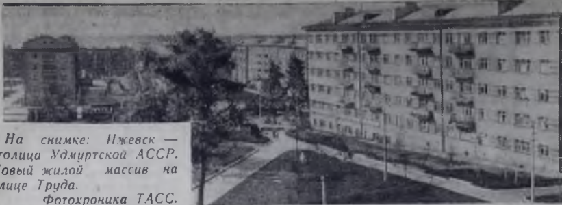
На снимке: Ижевск — столица Удмуртской АССР. Новый жилой массив на улице Труда.