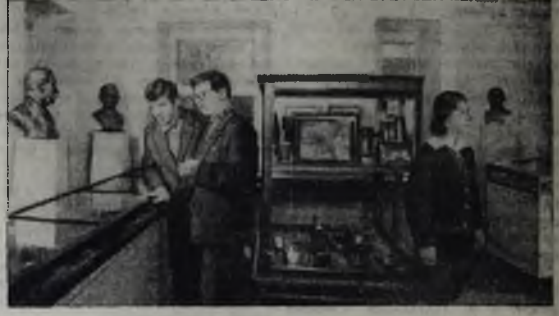
На снимке: в музее палехского искусства.

Палех — в недалеком прошлом село, а теперь районный центр Ивановской области — знаменит своим народным искусством росписи. Здесь работает около 150 мастеров кисти, есть художественное училище в музей.