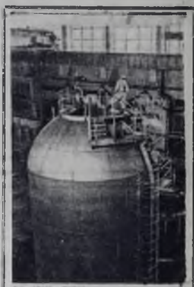
На Пововоронежской АЭС находится в пусковой стадии первый блок электрической мощностью 200 тысяч киловатт. На снимке: в реакторном зале. Крышка реактора.

Проекты получают за несколько месяцев до начала монтажных работ. Их внимательно изучают, проверяют принципиальные и монтажные схемы контроля и автоматизации, соответствие физических объемов — проектам, а также наличие на складах необ-