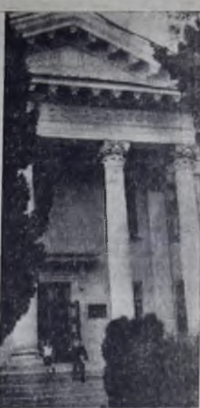
Сочи. Музей Н. Островского.

7. Ну, кто из нас поверит глупым бредням, что будто нет давно его в живых?! Его шинель я плем висит в передней, как будто он сейчас повесил их,