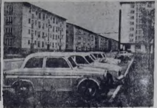
Хойерсверда — новый социалистический город Германской Демократической Республики, выросший за годы народной власти рядом с большим промышленным комбинатом «Шварце пумпе».

За семь лет существования города (строящегося по соседству со старым городком того же названия) здесь появилось более 8.300 квартир, различные культурно-бытовые учреждения. В этом году жители получают еще 1.300 квартир. Население новой Хойерсверды составляет сейчас свыше 25.000 человек.