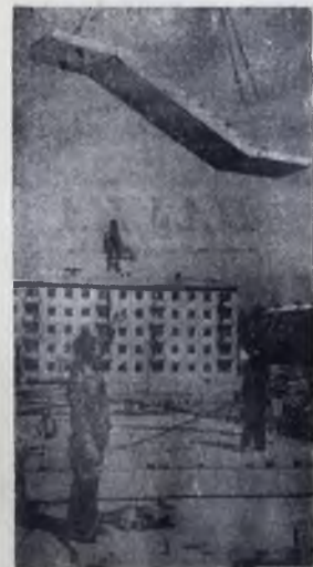
— Вира! — звучит над домом... Так рождается четвертый микрорайон.

МПК на языке технологов значит — межцеховые коммуникации, артерии, связывающие между собой установки по переработке