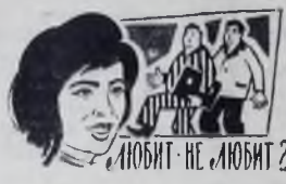
ЛЮБИТ - НЕ ЛЮБИТ 2.