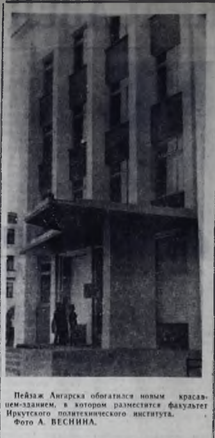
Пейзаж Ангарска обогатился новым красивым зданием, в котором разместится факультет Иркутского политехнического института.