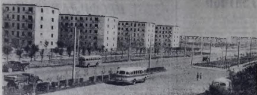
ВОЛЖСКИЙ. Проспект имени В. И. Ленина.