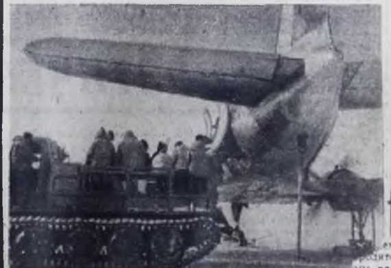
На снимке: разгрузка самолета, доставившего грузы на станцию «Восток».