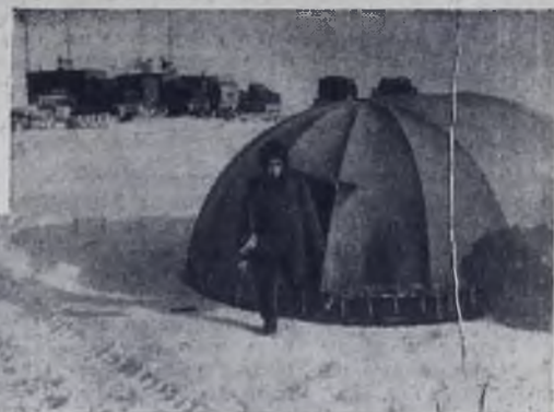
На снимке: в расположении лагеря.