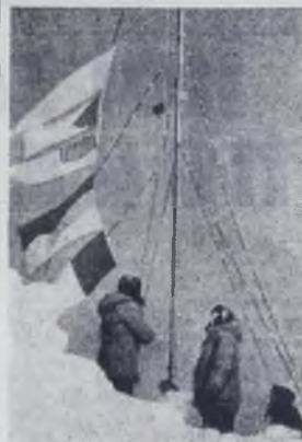
На снимке: подъем государственных флагов на станции «Восток».

Ученые 9-й Советской антарктической экспедиции проводят комплексные исследования по широкой программе Международного года спокойного Солнца. Большой интерес для науки представляют работы, выполняемые коллективом полярников на внутриконтинентальной станции «Восток», находящейся на высоте 3 500 метров над уровнем моря в районе Южного геомагнитного полюса и Полюса холода Земли. В условиях сильных морозов, нередко превышающих минус 80 градусов, и пониженного атмосферного давления советские ученые проводят систематические наблюде-