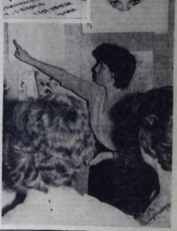
Редактор В. И. ПАНФИЛОВ