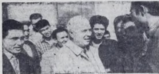
Н. С. Хрущев среди нефтяников из бригады коммунистического труда Ораза Атаева (Туркменская ССР, промысел «Лениннефть», сентябрь 1962 г.).