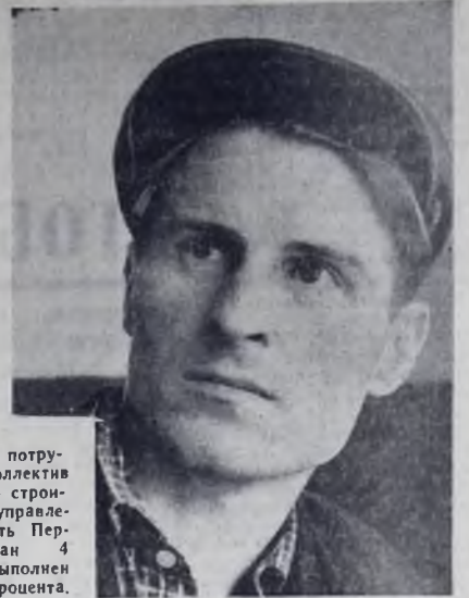
Отлично потру- дился коллектив ремонтно - строи- тельного управле- ния в честь Пер- вой. План 4 месяцев выполнен на 107,2 процента.

Год издания 13-й № 90 (2290) ПЯТНИЦА, 8 МАЯ 1964 года Цена 2 коп.