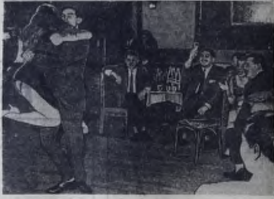
Редактор В. И. ПАНФИЛОВ

АНГАРСКАЯ АВТОБАЗА принимает заявки от населения и организаций города на обслуживание автобусами экскурсий, выездов в театры, для обслуживания делегаций и другие услуги. Стоимость тарифа за 1 час пользования автобусом: 30-местный — 3 рубля 90 коп. 23-местный — 3 рубля 40 коп. 20-местный — 2 рубля 90 коп. Заявки принимаются по адресу: проспект Кирова, 40, телефон 2-27-24. (419).