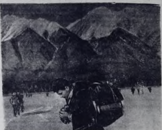
Фото и текст М. ПЛОХОТНИКОВА.

А впереди нас ждут горы. И кажется, что они зовут. Рядом.