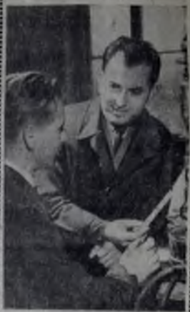
ЗАКАРПАТСКАЯ ОБЛАСТЬ. Научные сотрудники Ужгородского университета