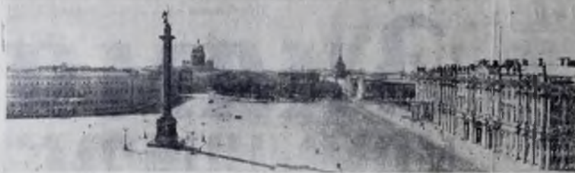
ЛЕНИНГРАД. Дворцовая площадь.

К 20-летию со дня полного освобождения Ленинграда от блокады