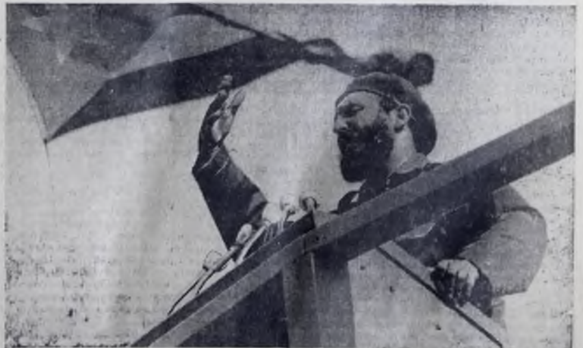
Фидель Кастро выступает в Гаване 26 июля 1963 года.

ТАШКЕНТ. Вместе с узбекской молодежью Новый год встречали и кубинские студенты. Праздник молодежи продолжался весь первый день января: «На Кубе в этот день два праздника, — сказал один из студентов. — День освобождения и Новый год. А мы, 17 студентов, отмечаем день Нового года с советскими друзьями. У нас в Гаване звучит музыка и наши кубинские песни. Эту встречу Нового года в Советском Союзе мы запомним на всю жизнь».