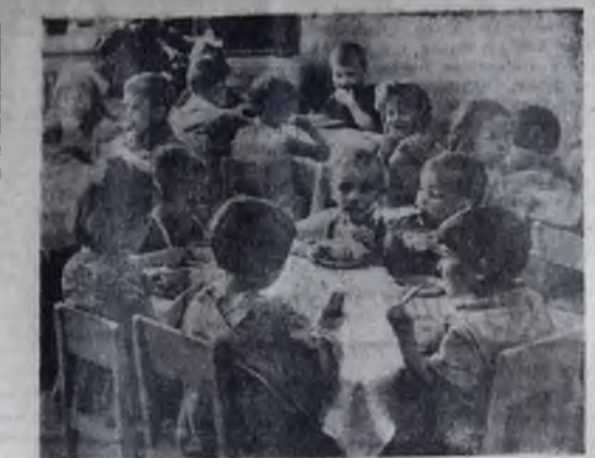
Добрую треть суток большинство наших детей проводит в дошкольных детских учреждениях.

Здесь их окружают ласковые, внимательные люди, прикладывают все силы, чтобы ребята росли здоровыми, жизнерадостными, добрыми. На снимке вы видите ребят детского дошкольного учреждения № 2, которому одному из первых в городе было присуждено почетное звание «Коллектив коммунистического труда».