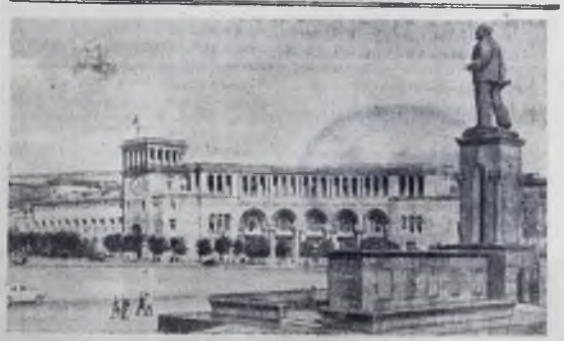
Армянская ССР. Площадь имени Ленина в Ереване.