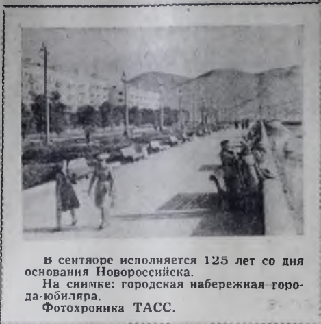
В сентябре исполняется 125 лет со дня основания Новороссийска. На снимке: городская набережная города-областера.