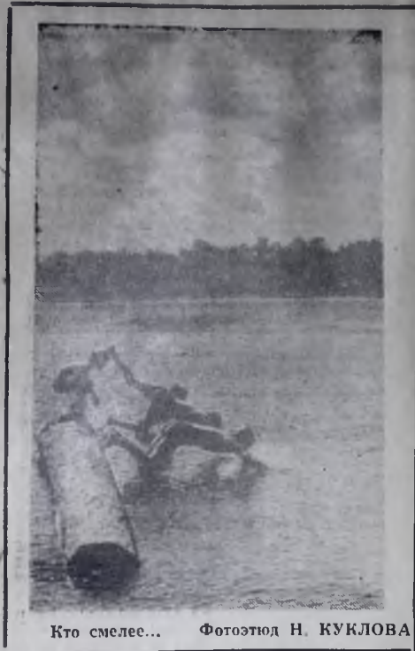
Кто смелее...

Валерий ЛУЦКИЙ, научный комментатор АПН.