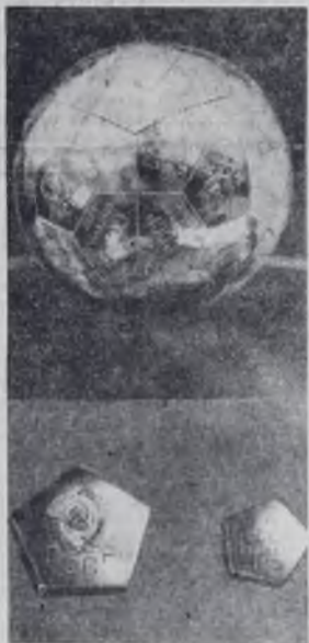
4 года назад (14 сентября 1959 г.) вторая советская космическая ракета достигла поверхности Луны.

На снимке: дубликаты выпелов и пятиугольные элементы выпелов, доставленных на поверхность Луны второй советской космической ракетой.