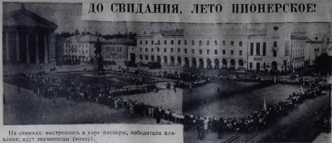
На снимках: выстроились в каре пионеры; победители плавания; идут знаменосцы (внизу).

4 сентября в 19 часов в актовом зале строителей (ШРМ-14, трамвайная остановка «Швейцария») состоится публичная лекция: «О международном положении». Лекцию читает С. Б. Каплун. Билеты продаются в актовом зале строителей и обществе «Знание».