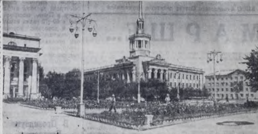
Советская площадь в городе Фрунзе.