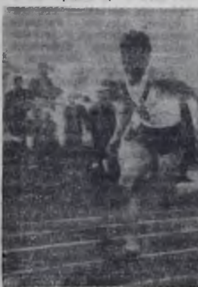
Идет эстафета 4x100 у мужчин.

Стало чуть-чуть грустно: ведь все три дня наш город жил большим спортом. И было жаль расставаться с полюбвишимися ангарчанами спортсменами, с гостями Ленинградцами, с москвичом