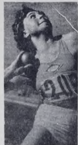
Сейчас ядро уйдет за 15-метровую отметку...

АНГАРСКОМУ ПОЛИТЕХНИКУМУ ТРЕБУЮТСЯ ПРЕПОДАВАТЕЛИ: инженер-механик по строительным машинам, инженер-механик по оборудованию газоперерабатывающих заводов, инженер-сантехник, преподаватель деталей машин, инженер-экономист по энергетическим дисциплинам. (806).