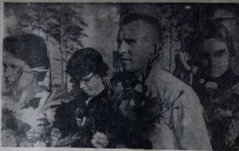
Цветы — лучший подарок чемпионам!