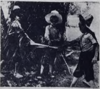
«Три мушкетера». Фотоэтид.

Обращаться: пос. «Шести тысячник», орс строительства, отдел кадров. (776)