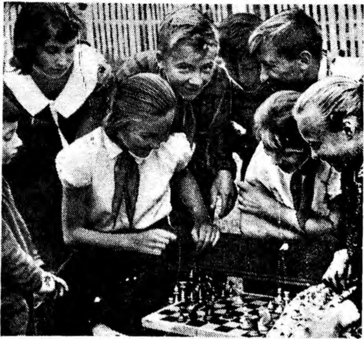
«Кажется, сейчас мат...»