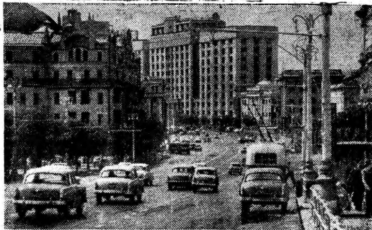
Москва сегодня. На проспекте Маркса. Фото Н. Грановского. Фотохроника ТАСС

Владимир ПРОМЫСЛОВ, председатель исполкома Московского городского Совета. (АПН).