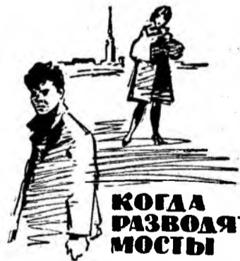
КОГДА РАЗВОДЯТ МОСТЫ