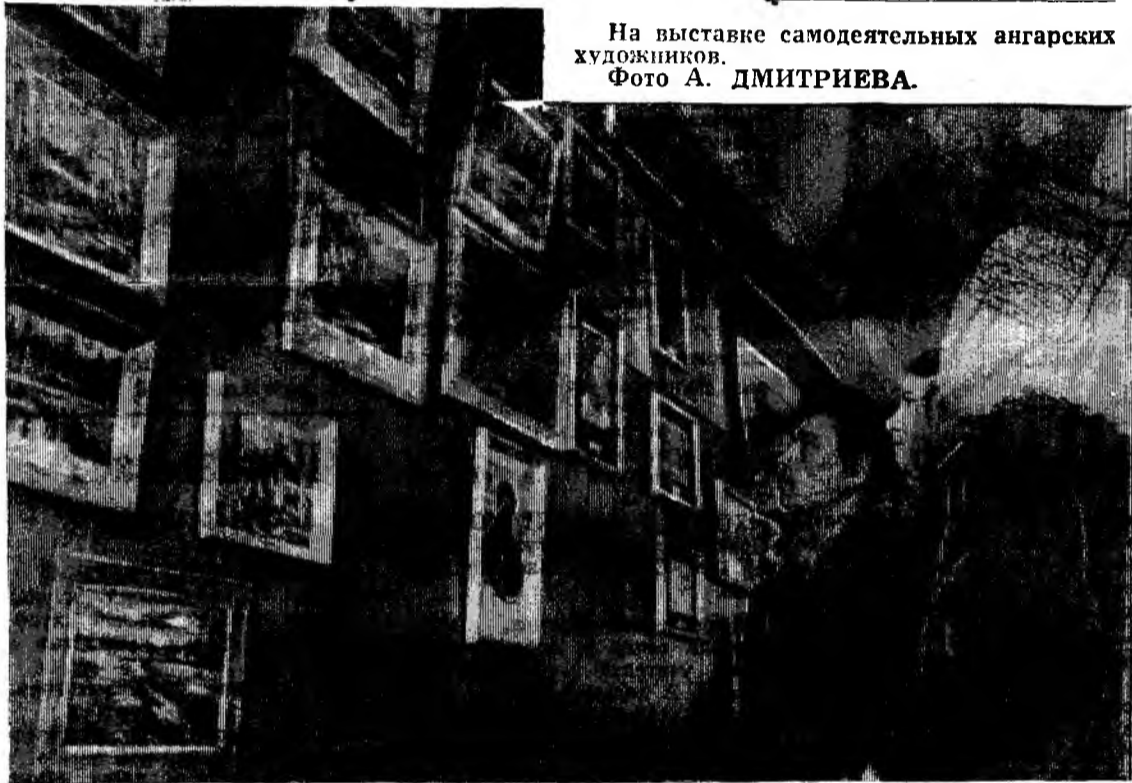
На выставке самодеятельных ангарских художников.