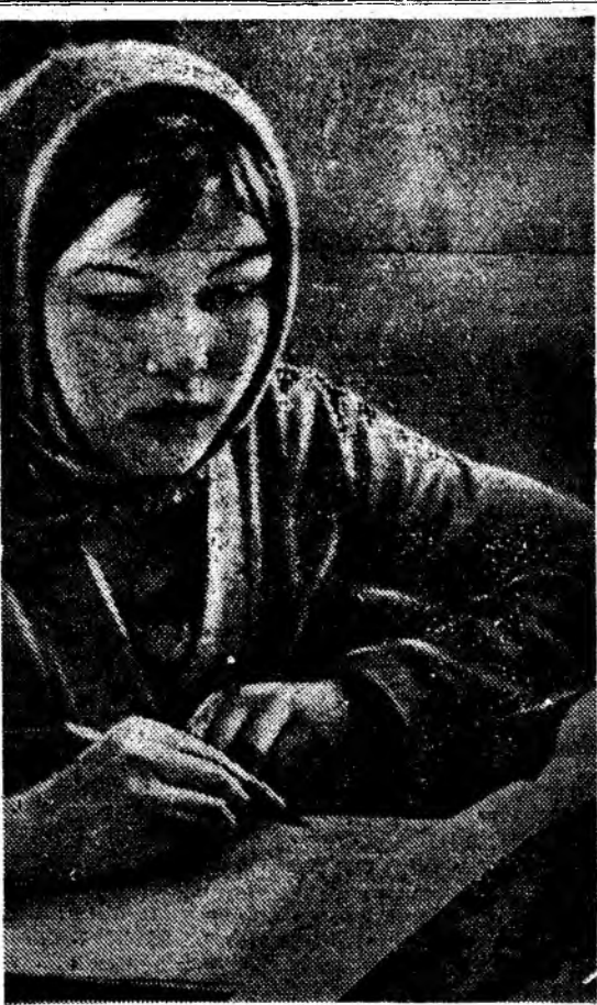
ДОМАШНЕЕ СОЧИНЕНИЕ. Фотоэтиюд Б. СТРОНГИНА.