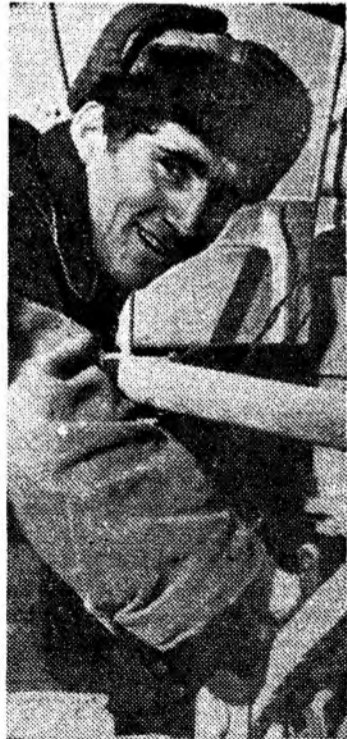
—У меня двойная радость,— сказал Михаил Сергеевич, электрогазосварщик Майского РМЗ,—во-первых, я стал членом великой партии коммунистов, во-вторых, родилась дочь. Михаил учится заочно в техникуме. План всегда выполнял на 115—120 процентов. На снимке: М. Сергеевич.