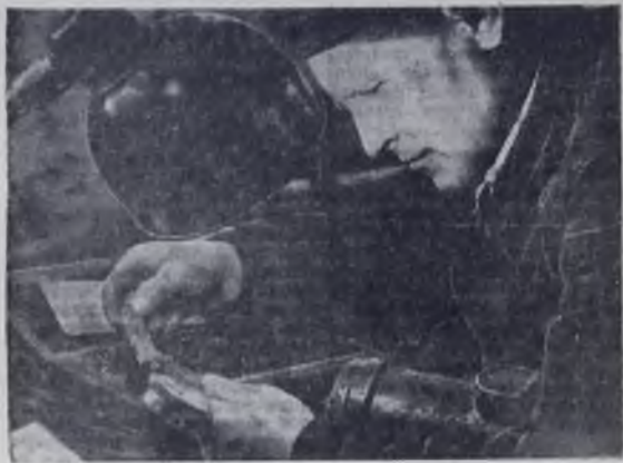
В шестом цехе электромеханического завода можно часто услышать: