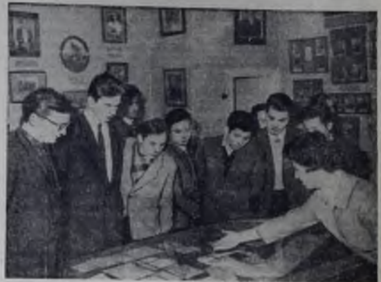
На снимке: посетители осматривают Дом-музей К. С. Станиславского.