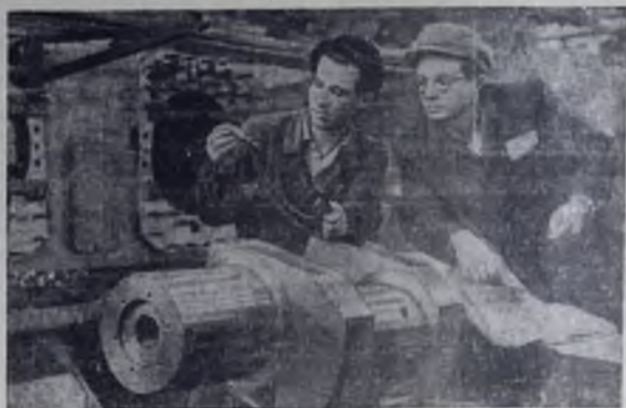
Замечательная инициатива коллективов двух горьковских предприятий — заводов фрезерных станков и «Двигатель революции», начавших поход за увеличение выпуска продукции без дополнительных капиталовложений, одобрена Бюро ЦК КПСС по РСФСР и находит широкую поддержку на других предприятиях.

Год издания 12-й 251 (1932) СРЕДА, 19 декабря 1962 года Цена 2 коп.