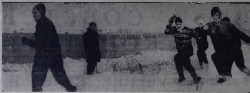
Сильнейшие легкоатлеты спортивного клуба «Ангара» шествуют над детской спортивной школой. На нашей снимке вы видите члена спортивной команды РСФСР Валентину Вишковскую, которая помогает юным легкоатлетам отработать технику прыжков в длину.

Начало занятий — 10 декабря в 18 часов. Запись — 6 и 7 декабря с 17 до 20 часов. Адрес: Ангарск, проспект Ленина, 46/14, учебный пункт (подвальное помещение). (991).