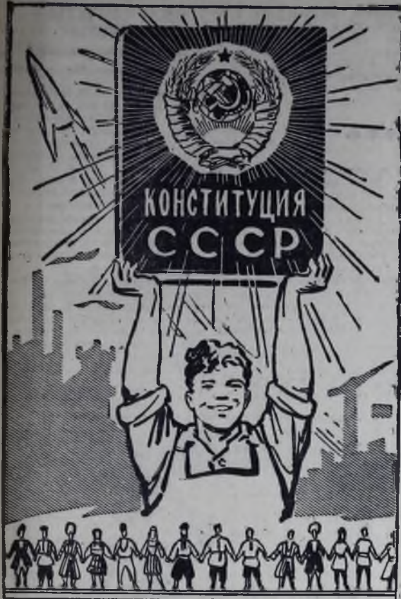
Плакат В. Жарипова.