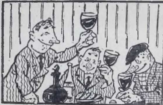
— Начали? — Начали...

В АНГАРСКЕ семь тысяч дружинников. Это огромная сила, способная оказать действенную помощь милиции в борьбе с хулиганством. И надо сказать,