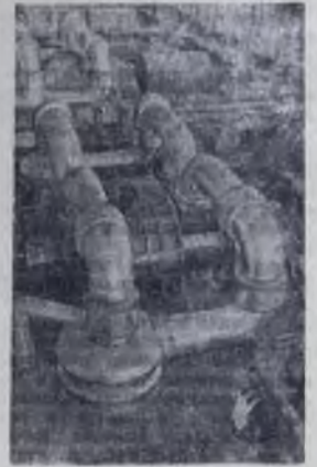
Воронежская область. Из огромного машинного зала Ново-Воронежской атомной электростанции уже ушли строители. Их место заняли прибористы, технологи и эксплуатационники. Им предстоит осуществить контрольными и исполнительными устройствами три турбогенератора мощностью по 70 тысяч киловатт.

На снимке: машинный зал атомной электростанции.