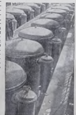
Армянская ССР. Новую трудовую победу одержали строители ереванского завода «Поливинилхлорид». Здесь досрочно завершены монтажные работы в цехе рекуперации.

В БЕЛЬГИЙСКОМ ГОРОДЕ МАМУЛЬ начался судебный процесс против восемнадцати осовских молодчиков из Франции, Алжира, Испании, Бельгии и Швейцарии. Как сообщает агентство «Дипуа», только шесть из них присутствуют в зале суда, остальные будут судимы заочно. Подсудимым предъявлено обвинение в незаконном хранении оружия.