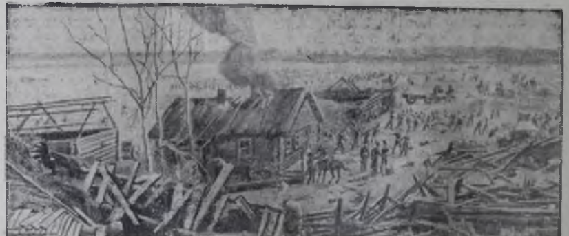
В Москве открылся музей-панорама «Бородинская битва». Автор — выдающийся русский художник Ф. А. Рубо. На снимке: фрагмент панорамы «Бородинская битва».