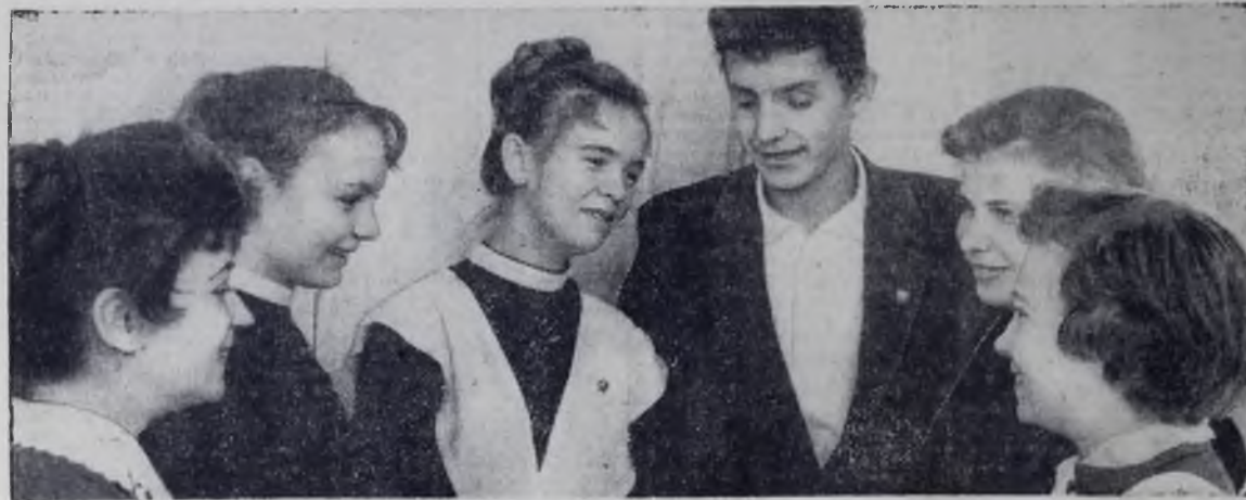
В канун Октября в ряды Ленинского комсомола были приняты сотни юношей и девушек. На снимке нашего корреспондента А. Елфимова вы видите школьников, вступивших в ряды ВЛКСМ.

На полях Саратовской области завершена пахота зяби. Вспахано более 4,4 миллиона гектаров пашен.