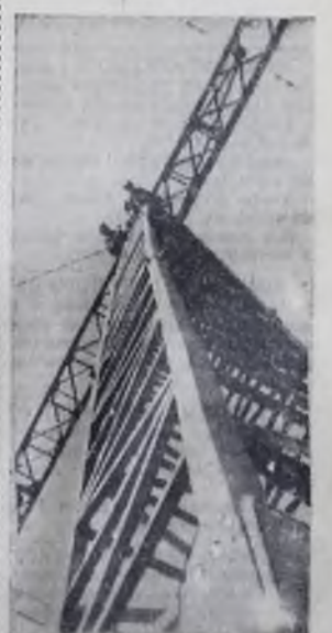
ПОД ОБЛАКАМИ.

ЗНАМЯ КОММУНИЗМА 31 октября 1962 г. Стр. 3.