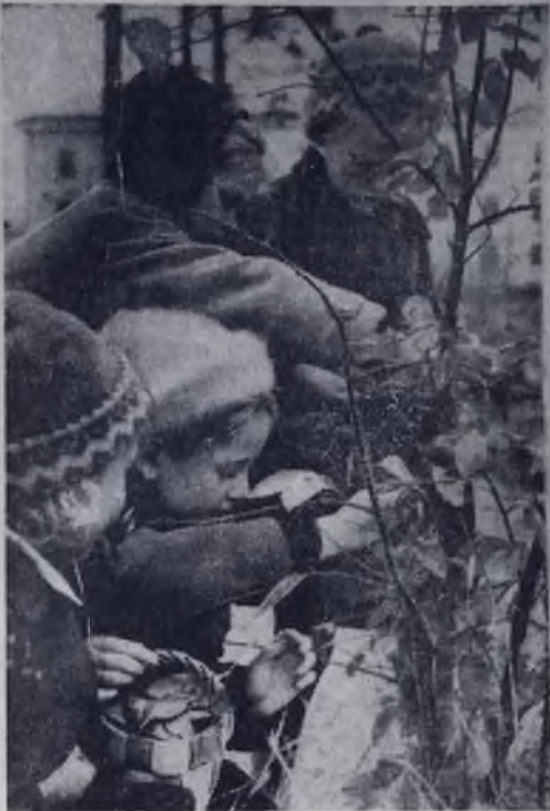
Этот снимок сделан недавно, когда в багрянец были наряжены деревья и золотом облиты травы. В такие дни парки и лес заполнены школьниками членами кружков юных натуралистов.

Богатые пополнения получают школьные гербарии.