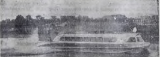
Начались испытания на воде крупнейшего в мире судна на воздушной подушке. Этот парашютный корабль, сооруженный экспериментально-исследовательским заводом Ленинградского института волного транспорта будет курсировать на реках любой глубины. Он сможет легко преодолевать перепады и мелководья, опираясь на поток магнетического под дном воздуха, и будет развивать скорость до 60 километров в час.

КОМИТЕТ ВЛКСМ Ангарского нефтеперерабатывающего завода, цеховые бюро стали более конкретно заниматься вопросами контроля над выполнением организационно-технических мероприятий.