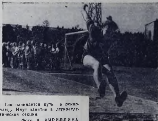
Так начинается путь к рекордам... Идут занятия в легкоатлетической секции.

«ПОБЕДА» — Черная чайка. 10, 12, 14, 16, 18, 20, 22.