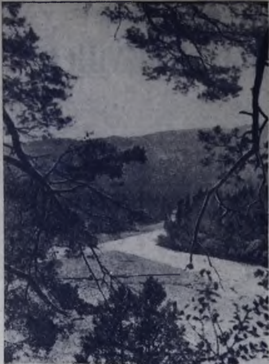
«Долина солнца».