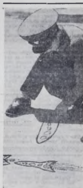
Думая о полетах.

Евг. ГАВРИЛОВ, респективный сотрудник редакции.