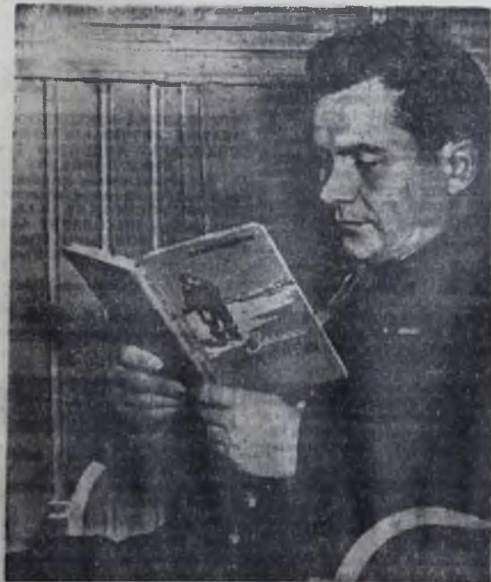
Космонавт-4 Павел Попович

Источники наших успехов—это социалистическая система, социалистический уклад хозяйства, социалистическое устройство нашего государства. Советские люди знают, что все успехи в развитии родной страны, ее экономики, науки и культуры непрерывно связаны с именем Владимира Ильича Ленина, деятельностью созданной им Коммунистической партии.