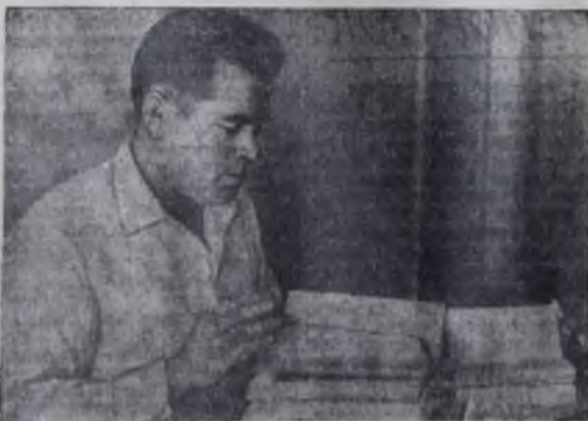
Космонавт-3 Андриян Николаев.