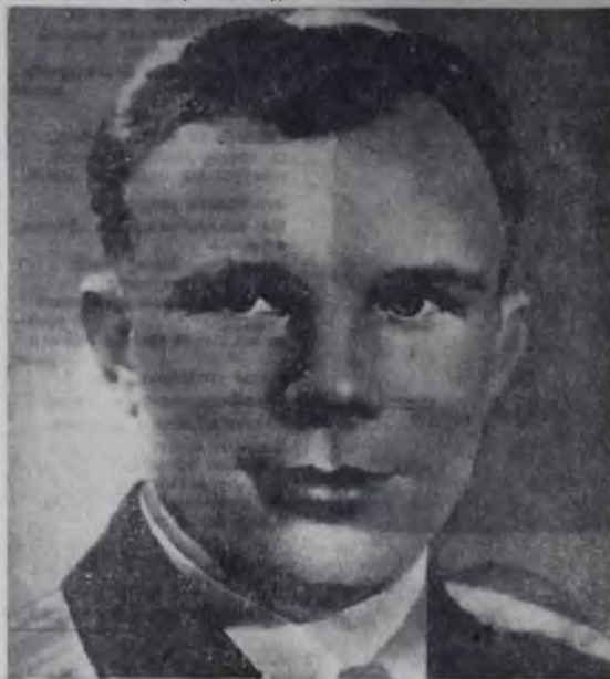
Космонавт-1 Юрий Гагарин.

Я счастлив с этой высокой трибуны доложить Коммунистической партии Советского Союза, Советскому правительству и лично Вам, Никита Сергеевич, что зада-