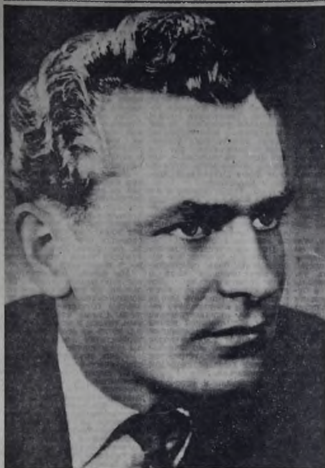
Космонавт-2 Герман Титов.